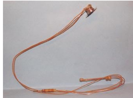
TERMOPAR CALENTADOR COINTRA CON CLIXON 110 °