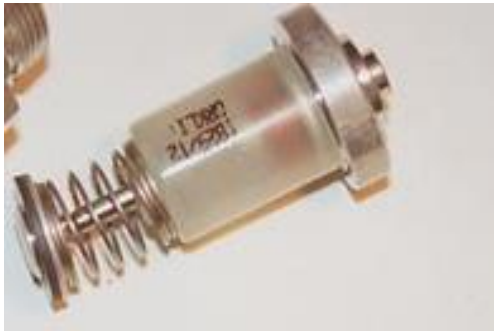
ELECTROIMAN CALENTADOR COINTRA 5 LITROS Ø 22 mm.