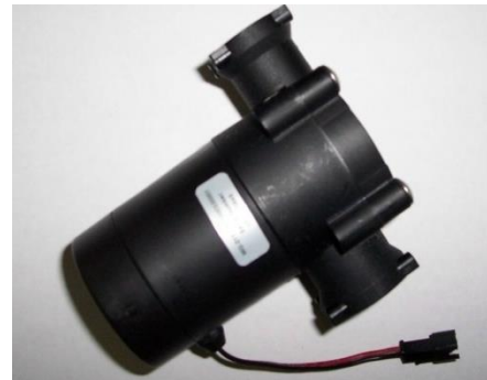
HIDROGENERADOR CALENTADOR COINTRA ORIGINAL (salida 90°)