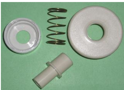
JUEGO PULSADOR PIEZO ELÉCTRICO CALENTADOR COINTRA