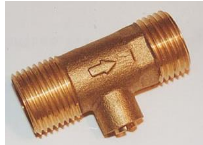
LLAVE CORTE CALENTADOR COINTRA ROSCA MACHO-MACHO