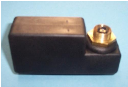
CAJA ACCIONAMIENTO AUTOMATICO CALENTADOR COINTRA ORIGINAL