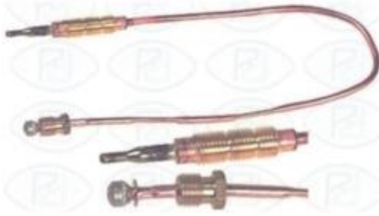
TERMOPAR CALENTADOR COINTRA 320 mm.